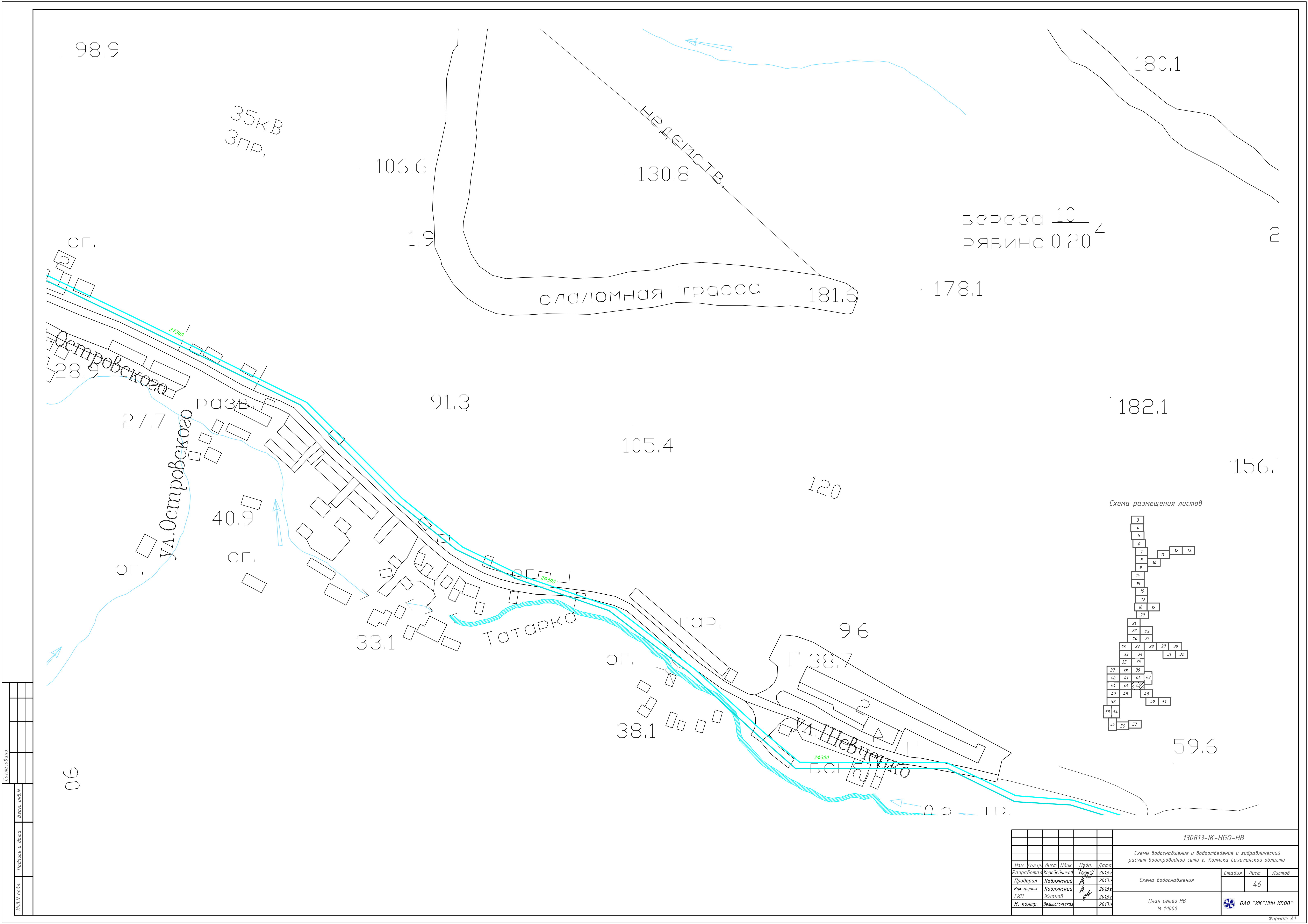
Схема размещения листов