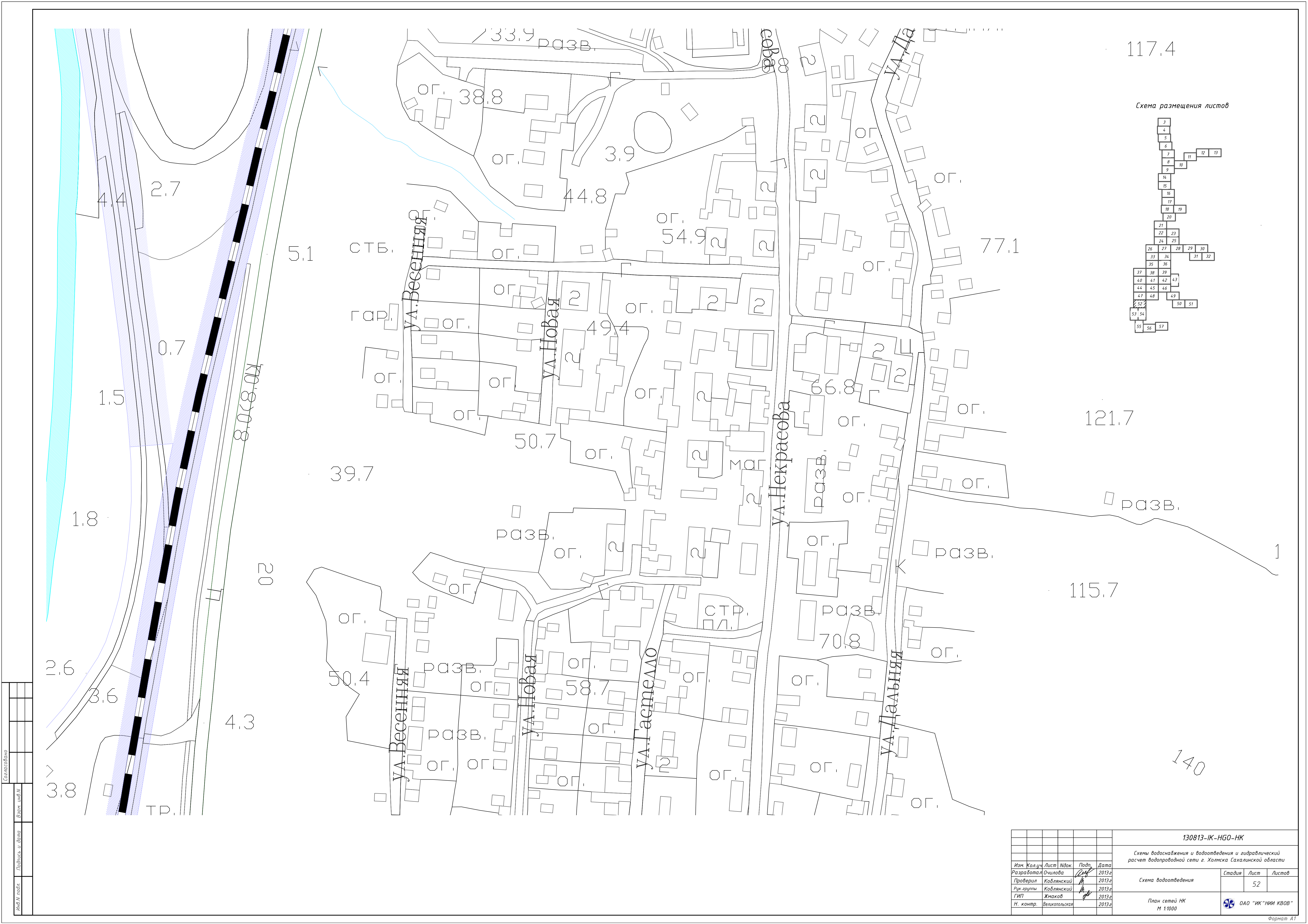
Схема размещения листов