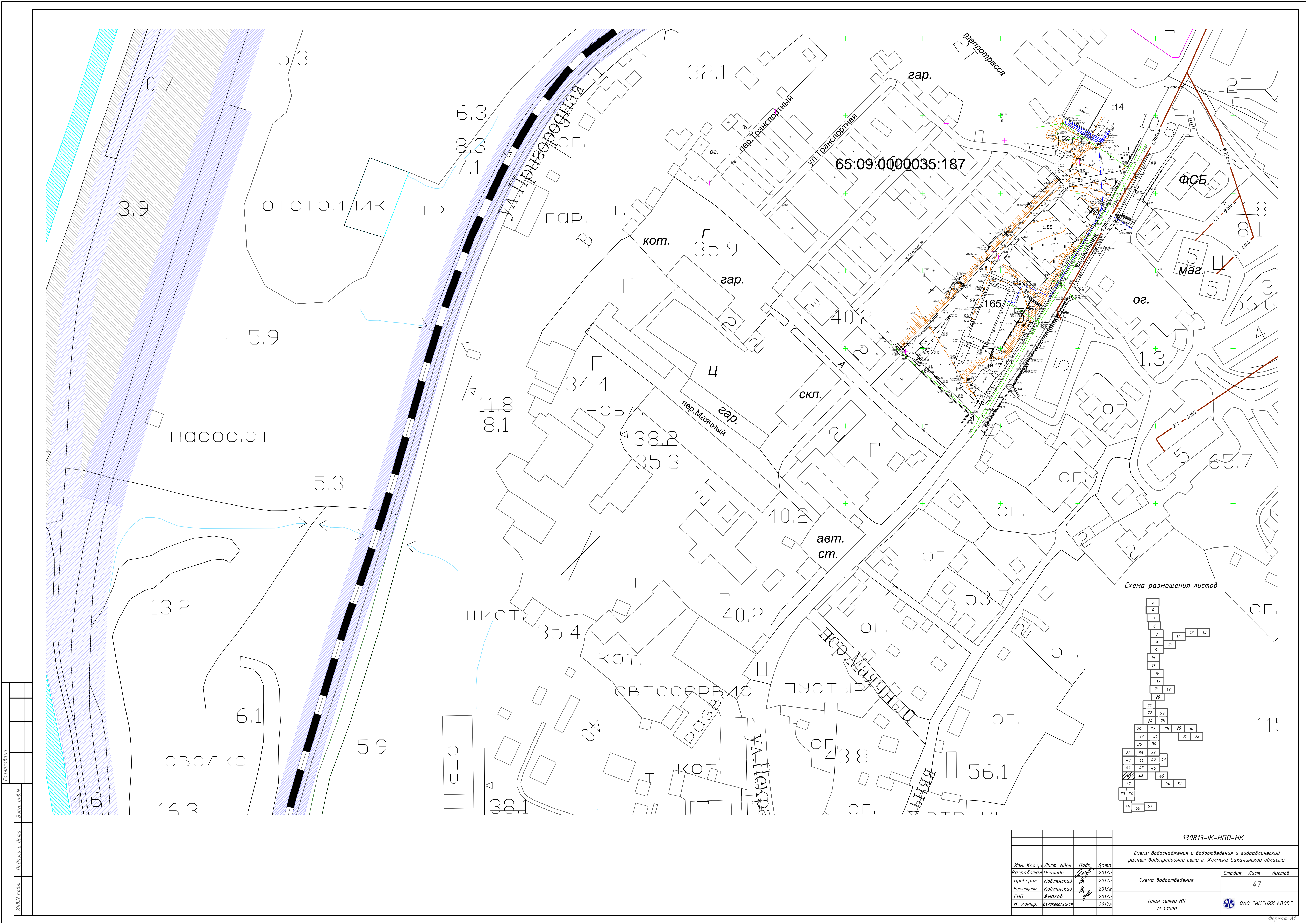
Схема размещения листов