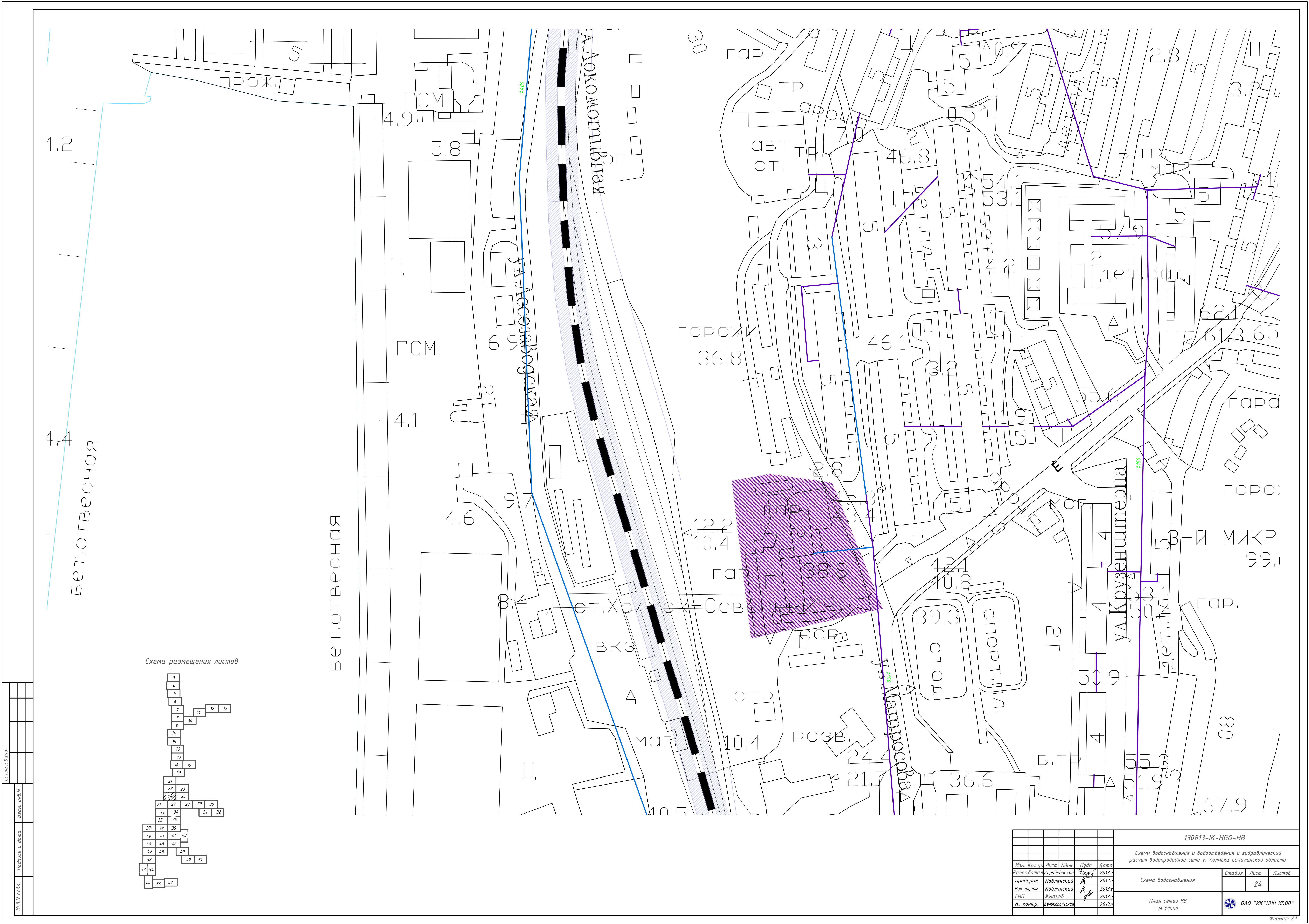
Схема размещения листов