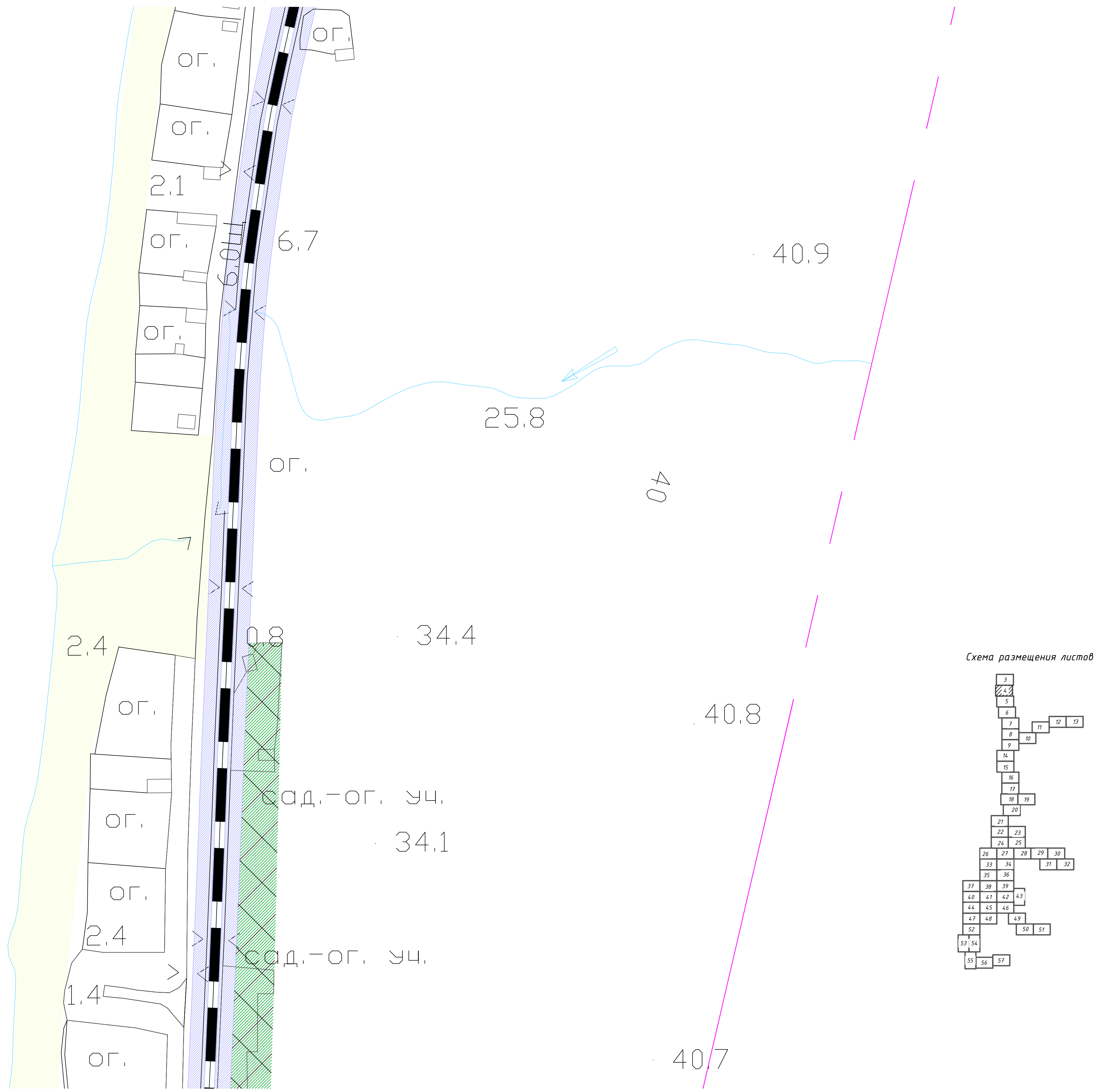
Схема размещения листов