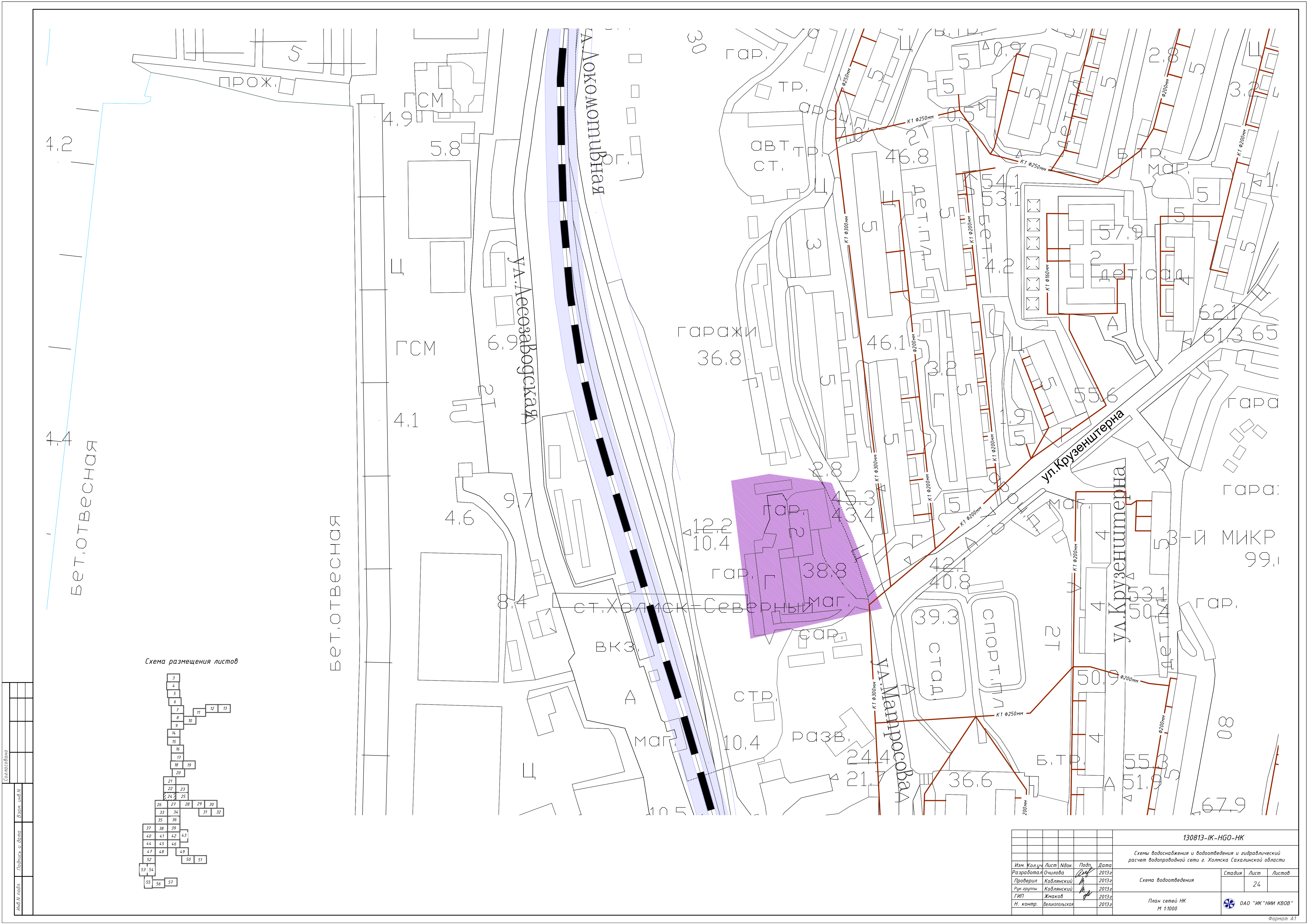
Схема размещения листов